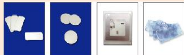
1228TA (IC 标签) 1150TAG (IC 标签) 保修标签 3层塑料外壳