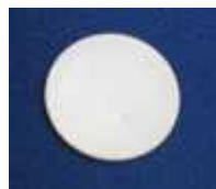
圆形 IC 标签 直径 1.5cm