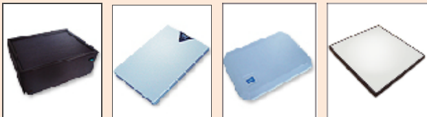
CR-M1000 Monster FRI-3100 FMR101 A/U 标签读取器 CR-S1500