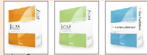
j-cas3 生厂商、批发商用 j-CAS Lite 系统综合用 j-CAS Shop 珠宝零售店用

所列商品均由 creedsystems 股份有限公司生产 (BS-GemPlatForma 除外)。