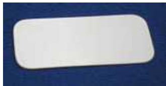
长方形 IC 标签 3.5x1.5cm